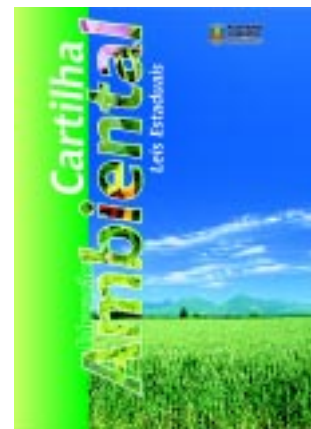
Cartilha da Educação Ambiental Lei nº 11.730/02