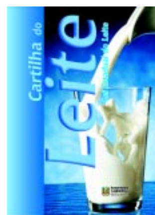
Cartilha que cria a Política Estadual do Leite Lei nº 12.429/06