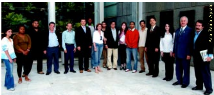
Alunos e professores da Escola Técnica Parobé em Grande Expediente em homenagem ao Empreendedorismo

A iniciativa prevê a criação de incubadoras empresariais dentro das escolas integradas, capacitação do