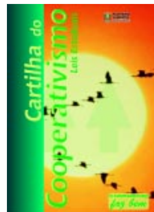
Cartilha do Cooperativismo Lei 11.829/02 e 11.995 Decreto 43.168